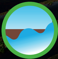
Ochrona przed wymywaniem