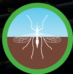
Ochrona przed insektami

Stosowanie folii może prowadzić do zwiększenia plonów nawet o 30%