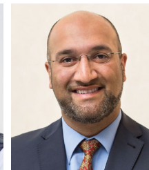
Asif Stöckel-Karim Elternschaft, Persönlichkeitsmodelle