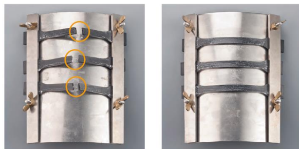
一般的なPBT B4330G6 HR